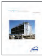
NC Steel Specifications