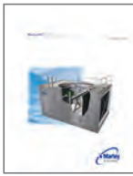
NC Steel Engineering Data