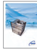
Marley AV Series Cooling Tower

SPX冷却技术是世界领先的全系列冷却塔和空气冷凝器制造商。本公司提供卓越品质的蒸发式冷却塔， 闭式冷却塔和蒸发冷凝器。品牌包括Marley, Recold和Balcke。