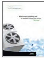
Marley MD Class Cooling Tower

SPX 冷却技术公司提供全系列的行业领先产品 — 通过我们卓越的支持和创新的设计帮助您最有效地使用您的冷却工艺。查看SPX 冷却技术公司的下列其他产品。