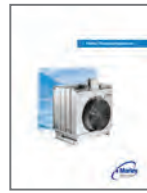
Marley Aquatower® Cooling Tower