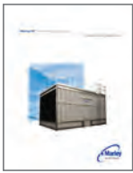
NC Fiberglass Engineering Data and Specifications

有关 NC 冷却塔的更多信息 — 包括工程示意图、数据、布置要求和其它信息 — 可向您的Marley销售代表索取副本或从 spxcooling.com 网站下载: