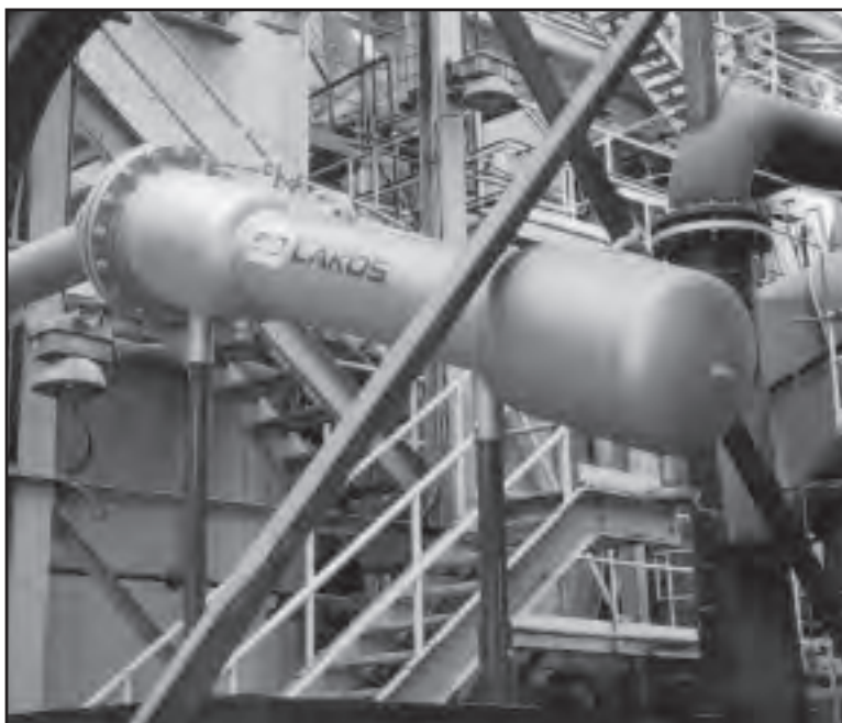
4台LAKOS PRX 不锈钢固液分离装置安装在Magma铜业公司

方案: 采用4台LAKOS PRX系列316L不锈钢制的固液分离器来处理洗涤废水。在第一天的24小时里, 一台LAKOS分离器就从中分离出来了4吨半的泥浆, 经进一步的分析, 其中48%的固体物质是纯度很高的铜。因此, 这一改进不仅是提高了整个系统的功效, 延长了整个系统设备的寿命。而且, 在投入使用一个季度后, 改造的投入成本就得到回收了。